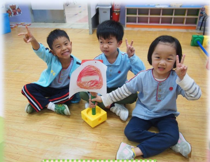
禁止車輛進入標誌